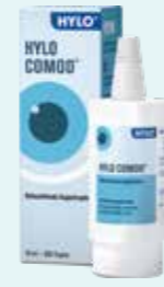
HYLO COMOD Befeuchtende Augentropfen* 10 ml

15,95 €** 12,45 € 21 % (1245,00 € / 1 l)