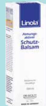
Linola Atmungsaktiver Schutz-Balsam 100 ml