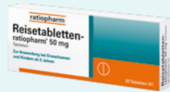
Reisetabletten-ratiopharm* 20 Tabletten