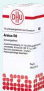
DHU Arnica D6 10 g