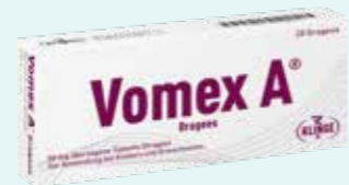
Vomex A Dragees* 20 überzogene Tabletten