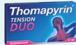
Thomapyrin TENSION DUO*1 12 Filmtabletten