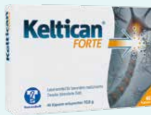
Keltican FORTE* 40 Kapseln

15,95 €** 12,45 € 21 % (1245,00 € / 1 l)