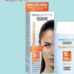
ISDIN FOTOPROTECTOR Fusion Water SPF 50 50 ml