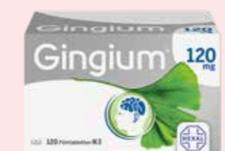
Gingium 120 mg * 120 Filmtabletten