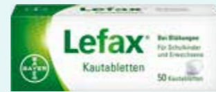
Lefax Kautabletten* 50 Kautabletten