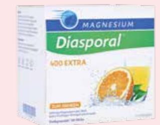
MAGNESIUM Diasporal 400 EXTRA 50 Sticks