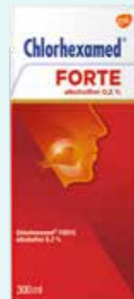
Chlorhexamed FORTE alkoholfrei 0,2 %* 300 ml