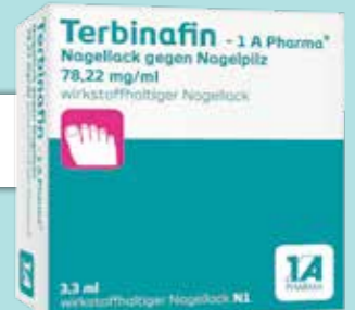
Terbinafin-1A Pharma Nagellack gegen Nagelpilz 3,3 ml