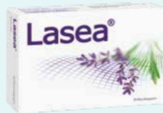
Lasea* 28 Weichkapseln