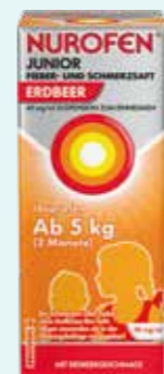
NUROFEN JUNIOR FIEBER- UND SCHMERZSAFT ERDBEER*1 100 ml